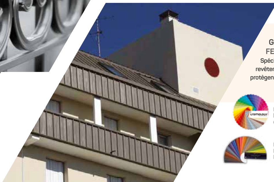
Chantier Zolpan-rue Bergon - ST ETIENNE