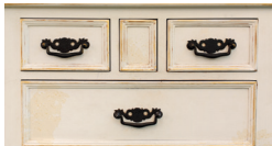
Tanin du bois

Ces taches sont souvent difficiles à masquer et peuvent réapparaître lorsqu'elles sont recouvertes d'une peinture classique. C'est pourquoi il est nécessaire de bloquer la tache par l'utilisation d'un produit adapté pour éviter ce phénomène.