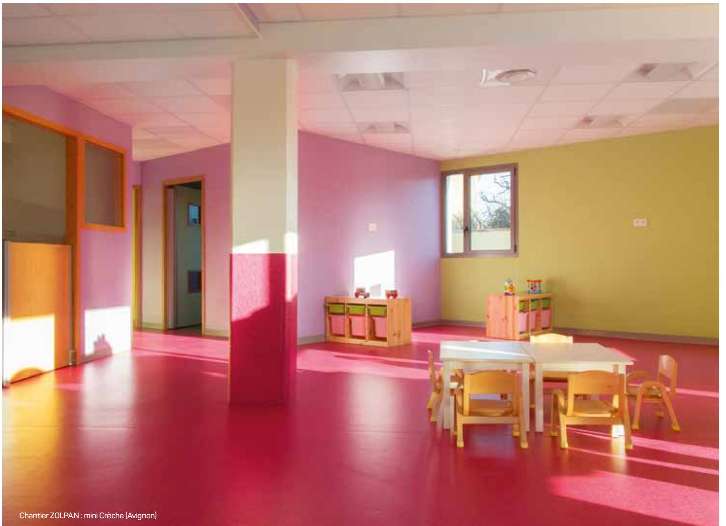
Chantier ZOLPAN : mini Crèche (Avignon)