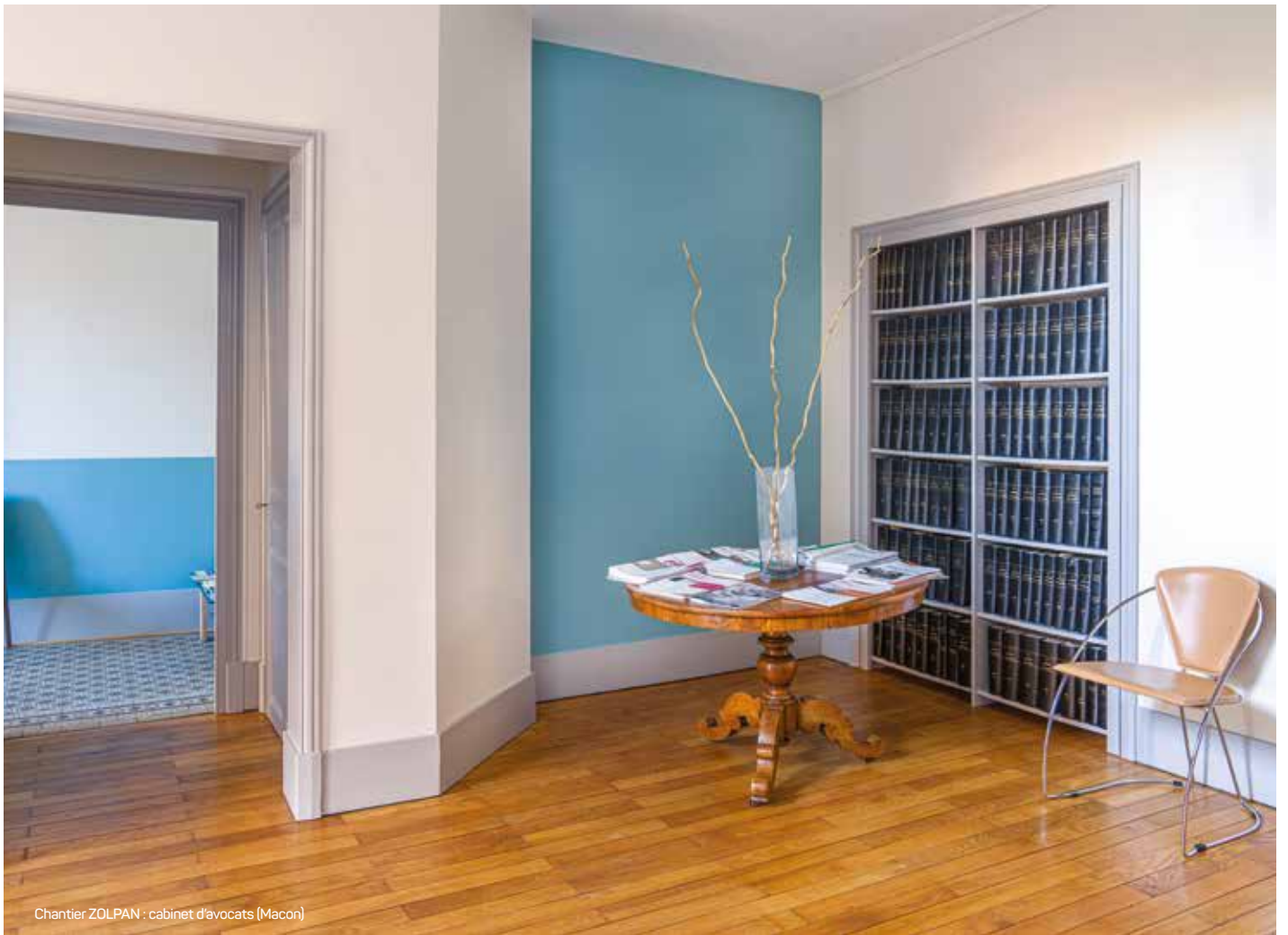
Chantier ZOLPAN : cabinet d'avocats (Macon)